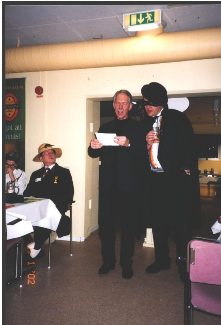
Urupförandet av Oxhornets snapsvisa !